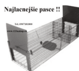
Najlacnejšie pasce !!