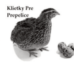
Klietky Pre Prepelice