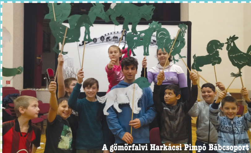
A gömörfalvi Harkácsi Pimpó Bábcsoport