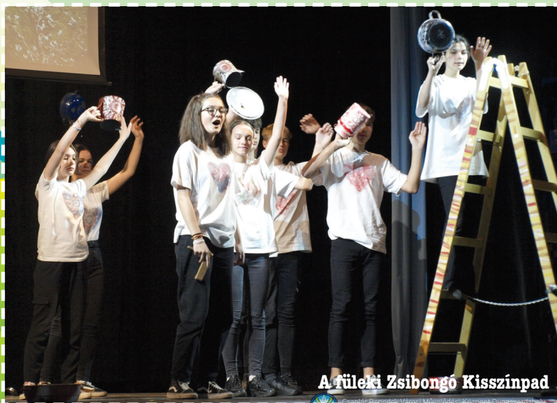
A füleki Zsibongó Kisszínpad