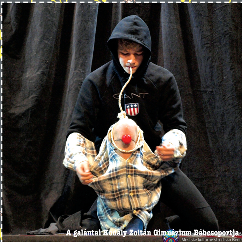
A galántai Kócsy Zoltán Gimnázium Bábcsoportja

Mi is nagyon szeretünk téged. Köszönöm. Nagyon jó volt!