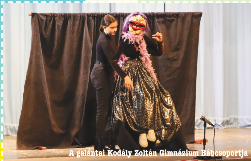
A galántai Kodály Zoltán Gimnázium Bábcsoportja