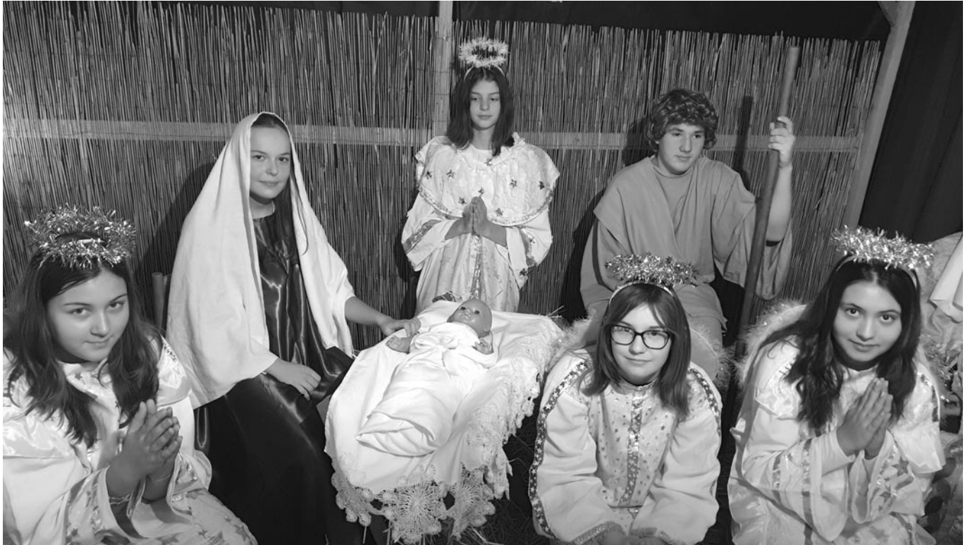
Befejezés az 1. oldalról

A kultúrház ajtaja e napokon mindenki előtt nyitva állt: nemcsak a jányoki lakosok tekinthették meg kedvükre az élő betlehemet, hanem bárki, aki arra járt.