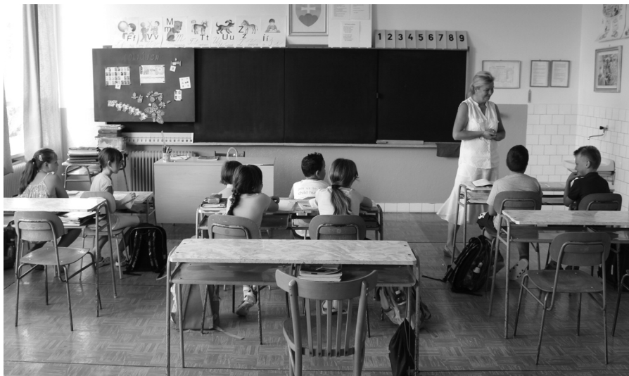
Szeptemberben senki nem ül be a padokba

Amikor ezek az adatok napvilágra kerültek, a polgármester rendkívüli önkormányzati ülést hívott össze, hogy megbeszélje a testület az iskola fenntartási lehetőségeit. „A következő években előreláthatólag még kevesebb gyermeket íratnak majd szülei a helyi iskolába, hiszen a születésekből is látszik, hogy kevés a gyermek. (Bár meg kell jegyezni, hogy számításaink szerint a helyi lakosok gyermekei közül jelenleg 17-en iskolakötelesek, ebből azonban csak 5-en látogatják az iskolánkat. A többiek a bőszi, illetve a csilizradványi intézményt részesítik előnyben.) Átvizsgálva a költségvetésünket elgondolkodtunk azon, hogyan és milyen forrásokból tudjuk működtetni az iskolát. A tanulói létszám után járó támogatás ugyanis nem elég, a kiadások megmaradnak, és még akkor sem telik a költségvetésből, ha csak egy tanerőt fogunk alkalmazni. Hiszen ilyen alacsony létszám mellé csak egy tanerőt tu-