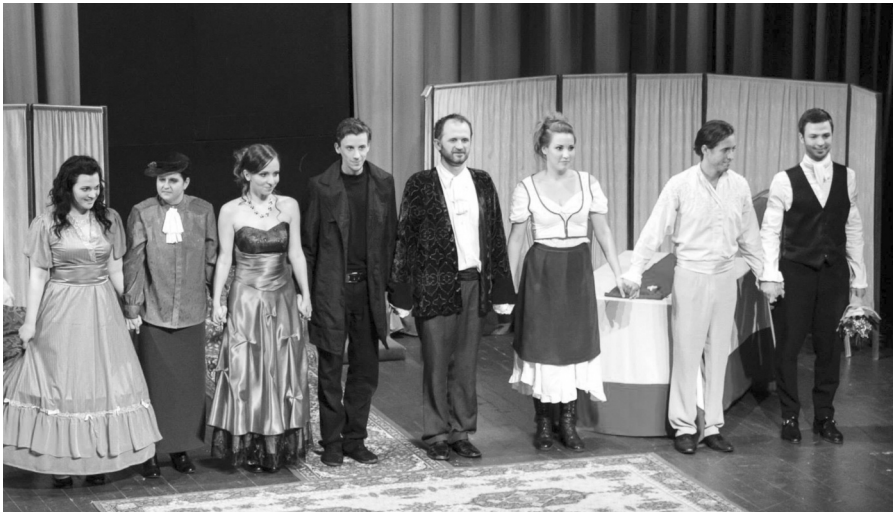
A Rivalda Színházzal (jobb szélén)