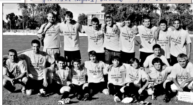
Družstvo dorastencov v roku 1977 a v roku 2009