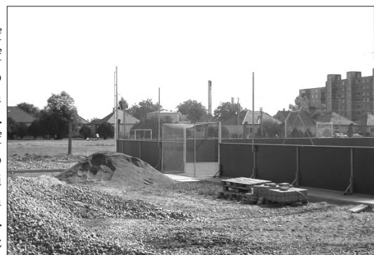
Zimný štadión teda nebude, napriek tomu sa ale ponuka športovísk v meste rozrastie: Za gymnáziom bolo postavené ďalšie multifunkčné ihrisko.

Aj keby stavebnú pripravenosť mesto dokázalo zafinancovať, čeliť by muselo požiadavke každoročného vykrytia polovice prevádzkových nákladov vo výške 153 tis. eur. Rovnakú sumu by mal zafinancovať zväz. Financovať by to mesto mohlo najmä zo vstupného, prenájmu časti priestorov alebo príspevkov okolitých obcí za využívanie objektu ich školami. Ako ďalšie možné zdroje uvádza zväz Nórsky finančný mechanizmus alebo dotáciu ministerstva školstva. Podľa predstaviteľov mesta sa v prípade dvoch posledných spomenutých zdrojov pravidelnosť nedá predpokladať, rovnako ani to, že okolité samosprávy budú schopné a ochotné spolufinancovať správu zimného štadióna. Po krátkom počítaní musí byť jasné aj to, že príjmy z komerčnej prevádzky ani zďaleka nepokryjú potrebné náklady. Po zvážení faktu, že aj mestské