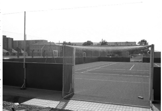
Téli stadion ugyan egyelőre nem lesz, városunk mégis gazdagodott sportterekben. A gimnázium mögött egy újabb többrendeltetésű sportpálya épült.

testület fokozott óvatosságra intett a projekt költségeivel kapcsolatban, ill. csak abban az esetben jelezte támogatását, ha a megvalósítás nem jár irreálisan magas kiadásokkal, kijelenthetjük, hogy városunkban egyhamar nem épül téli stadion. (ik)