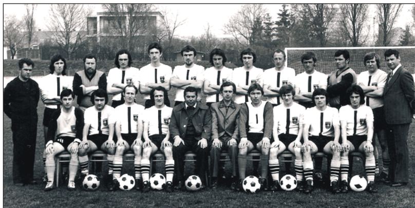
Družstvo dospelých v 70. rokoch