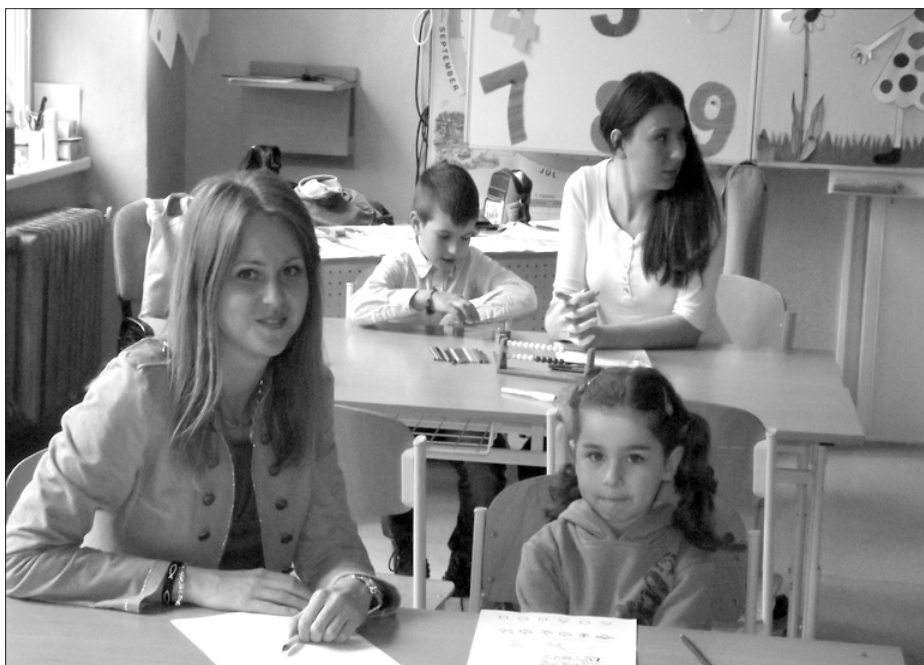
Začiatkom apríla sa uskutočnili zápisy budúcich prvákov do želiezovských základných škôl. V slovenskej ZŠ zapísali 52, v maďarskej 36 detí, konečné počty ale ešte ovplyvnia prípadné odklady.