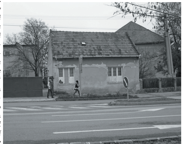
Jedným z návrhov na zvýšenie príjmov mesta, o ktorom budú poslanci začiatkom tohto roka rokovať, je aj predaj skladu v areáli ZŠ s VJM.