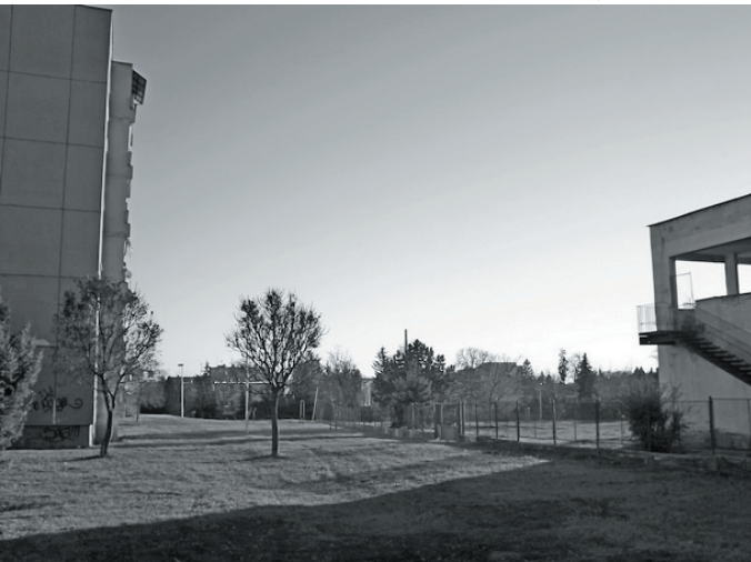
Najvhodnejšou sa nakoniec ukázala pôvodná lokalita.