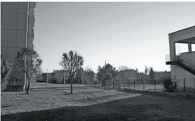
Az egyházközség szerint leginkább az erdélyi, patak melletti helyszín felel meg.