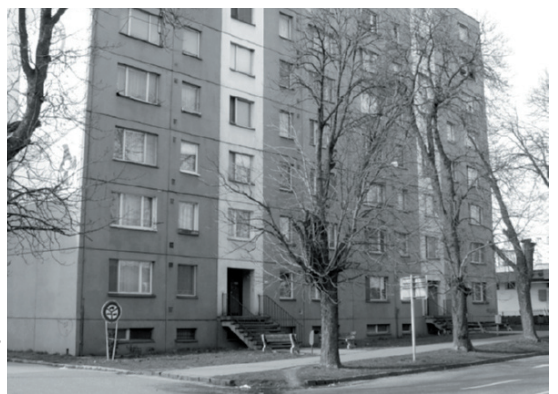
Az előterjesztett javaslato-k között szerepel a gondozói szolgálat épületének eladása is.