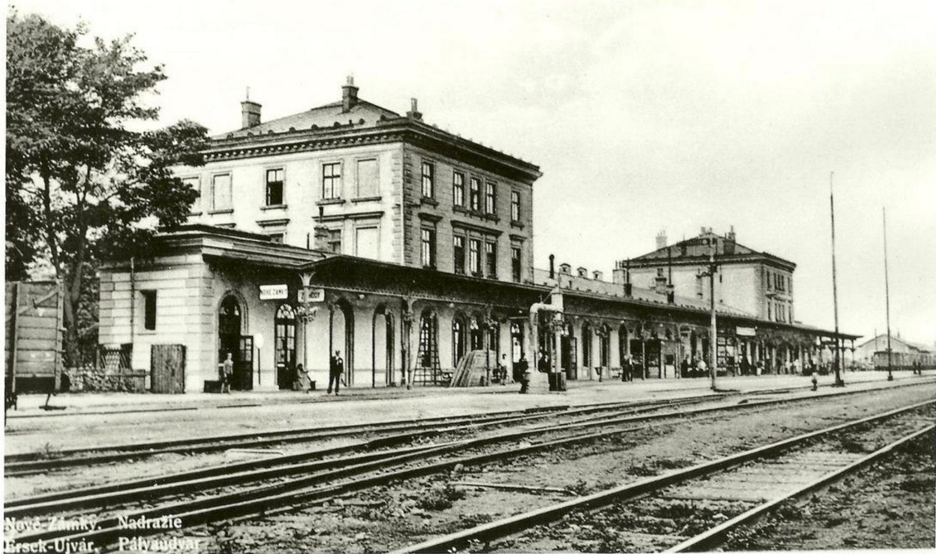
Nové Zámky. Nadrazie Ľíšek-Ujvár. Pálvaudvar