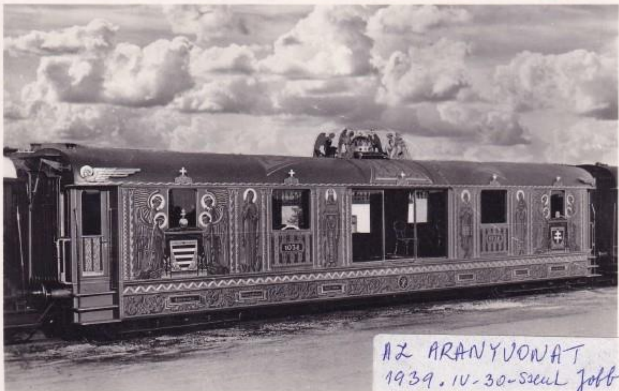
AZ ARANYVONAT 1939. IV-30-szek Jobb