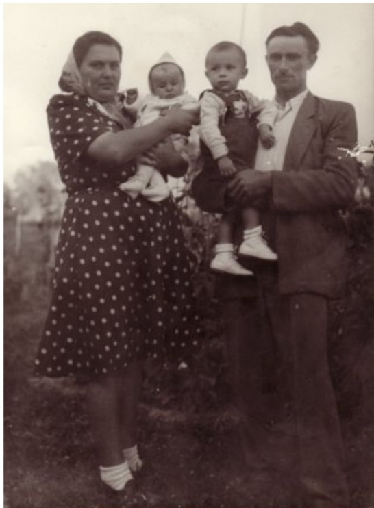
Csicsói történetek 3.

Szülőföldünk, a Felvidék történelmét, úgy tűnik, már sokan megírták. Akkor szükség van-e a Csicsói történetek harmadik részére? Ezekre a kételyeimre a válasz: ha mindenki, minden család megírná külön-külön a történetét, az sem lenne hiábavaló.