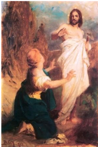
„Noli me tangere!” (Ne érints engem!) Benczúr Gyula festménye

sokszor nem tükrözi ennek a csodának a valóságát. Az Egyház sokszor úgy él ebben a világban, mintha neki az lenne a feladata, hogy őrizze nagy halottjának az emlékét. Múzeumokat, katedrálisokat emelt Jézus emlékére, csak éppen élet, valóság nincsen benne. Az emlékezők megérkeznek,